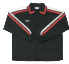
▲ブラック×ホワイト▼