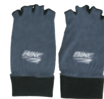
▲ネイビー×ホワイト