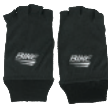
▲ブラック×ホワイト