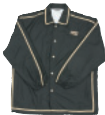
▲ブラック×ゴールド▼